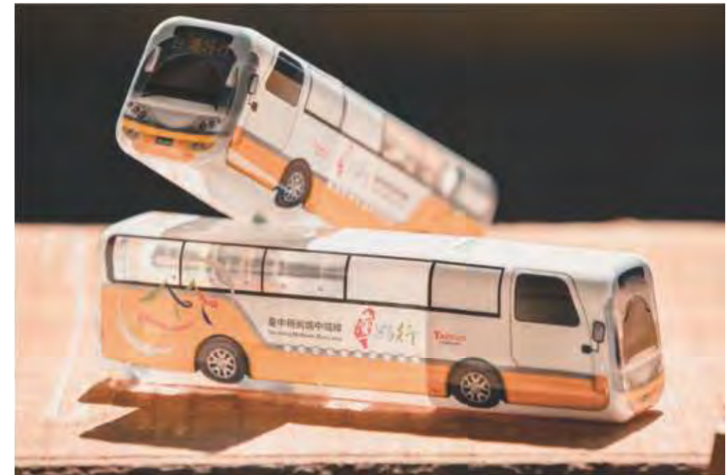
觀旅局-台灣好行-臺中時尚城中城線

為加強本市台灣好行-臺中時尚城中城線宣傳，製作台灣好行-臺中時尚城中城線造型水於行銷活動宣傳，以提升其知名度。