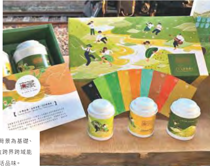
文化局-2022 TCOD台中原創 視覺及包裝設計類

創立於2009年，以傳承三代的種茶及製茶專業背景為基礎、科技人的嚴謹與堅持為後盾、整合企劃的全方位跨界跨域能力，與服務創新熱忱，同時融入美學與設計的生活品味。