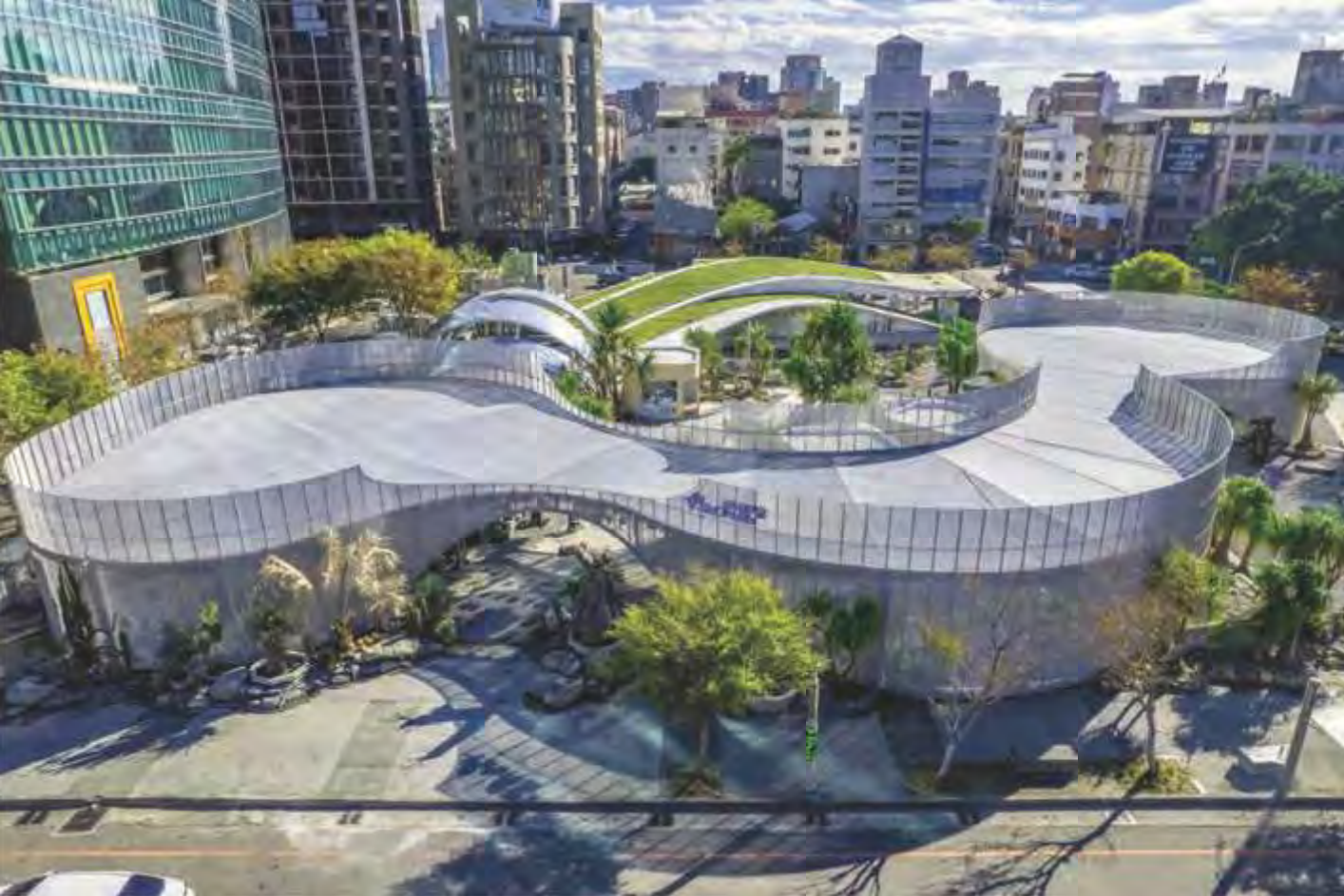
臺中PARK2草悟廣場-榮獲3座國際設計大獎