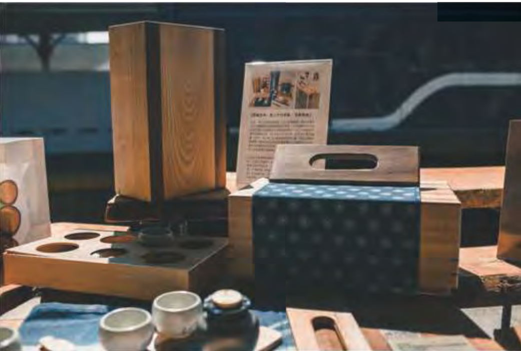
教育局-臺中市陶藝教學中心111年營運計畫