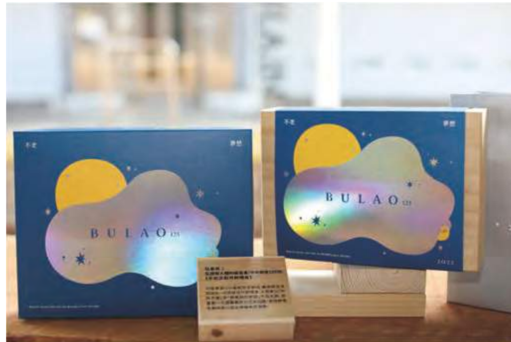
社會局-弘道老人福利基金會-不老夢想125號

不老夢想125號和百年餅店-舊振南及早起設計，共同推出月餅禮盒！主視覺以「中秋月圓」及「銀髮族的夢想」作為主軸，前景是一片透著銀色光芒的白雲，象徵銀髮長輩微微仰望並帶著微笑尋夢。