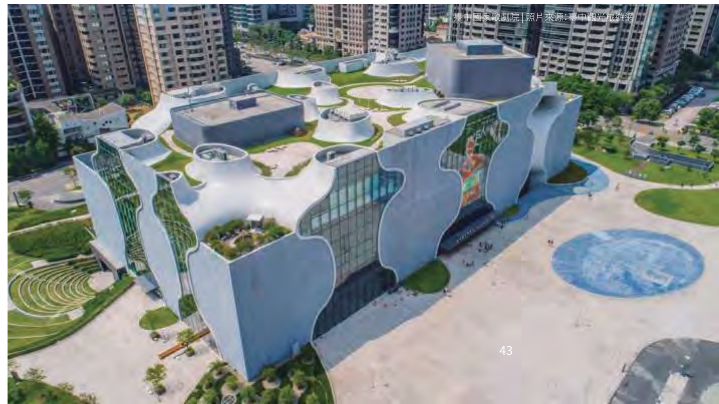
臺中國家歌劇院

風格形塑識別度，這是成為國際級城市的必備元素。貫穿臺中市區的綠園道與歌劇院都是世界級的識別，再加上規劃有序的都市開發與建設，讓臺中的天際線已有著國際大都會的氣勢與樣貌。每年10月由「文化局」主辦、集結各局會全力總動員的「爵士音樂節」，為臺中暈染上輕鬆悠閒的色彩，爵士旋律串起了人潮、觀光與產業，萬千旅客從各處造訪，一起感受臺中獨有的Jazz氛圍，也為臺中帶來國際級城市的識別度。而「新聞局」推動以充滿異次元的動漫或影像創作，轉化「臺中學」文化底蘊與精神，更看見一座城市天馬行空的創意語彙。「觀旅局」透過美食之旅，呈現臺中多元美食特色及獨特風貌；來趟臺中之旅吧！以五感完整體驗臺中Style的獨特魅力！