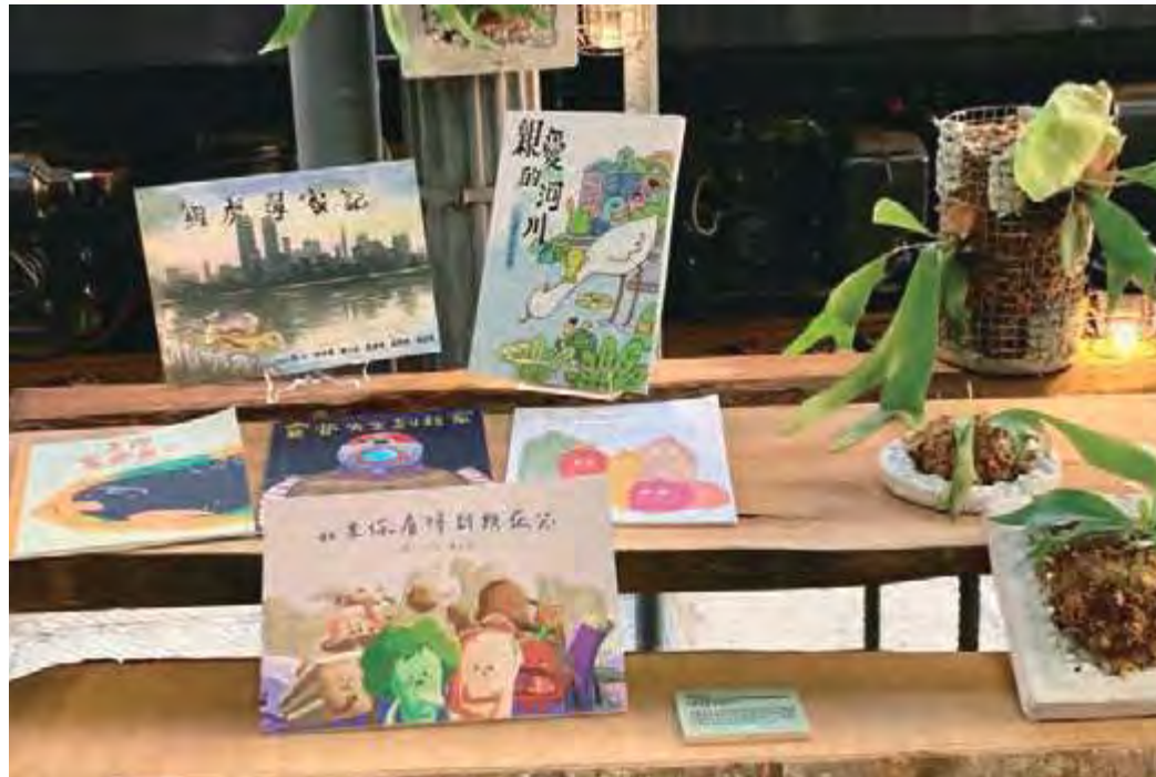
環保局-111年臺中市政府執行環境教育專案計畫