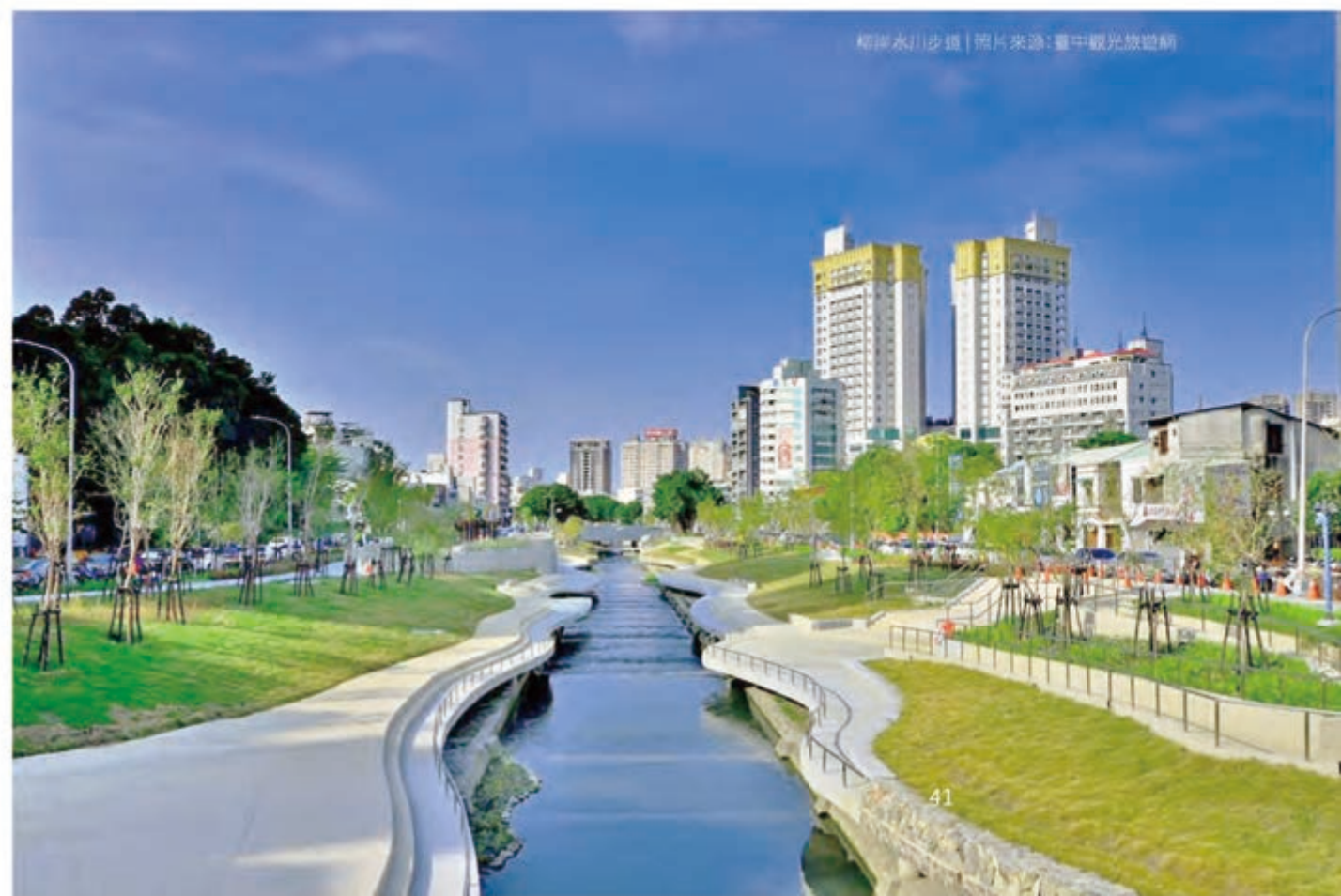
和洋水川步道 | 照片來源：臺中觀光旅遊網

蓊鬱的山林和波光粼粼的海，都一樣迷人！臺中是一座兼備山與海的城市，從高美濕地到東勢林場，一小時內的車程，以一個很親近的距離，滿足各種樂活的心；得天獨厚的自然景致，造就與自然共存共榮的生活樣貌，不論是「觀旅局」為推廣表彰五度完登谷關七雄的《紀念水壺》、「水利局」透過走讀水文化之都，讓市民一覽河川文化的生命力、抑或是帶上由「教育局」所推出的大甲陶結合藍晒染布的《旅人茶箱》，踏青以茶會友，在山水之間，人各安其所，自得其樂，就是這座樂活城市的願景。